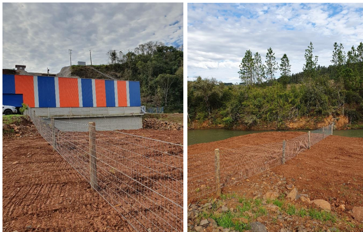
Figura 7 - Cercamento do canal de fuga da CGH Tapera 2A

Constatou-se que o canal de fuga da CGH Tapera 2A foi cercado de maneira eficaz, evitando possíveis quedas acidentais bem como passagem de fauna. Os registros do cercamento encontram-se a seguir.