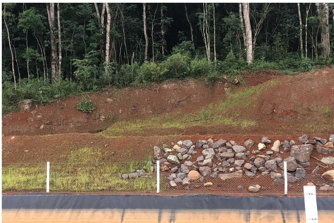
Figura 2 - Exemplo de cercamento.

As imagens a seguir exemplificam como será o cercamento aplicado ao canal de fuga da CGH Tapera 2A.