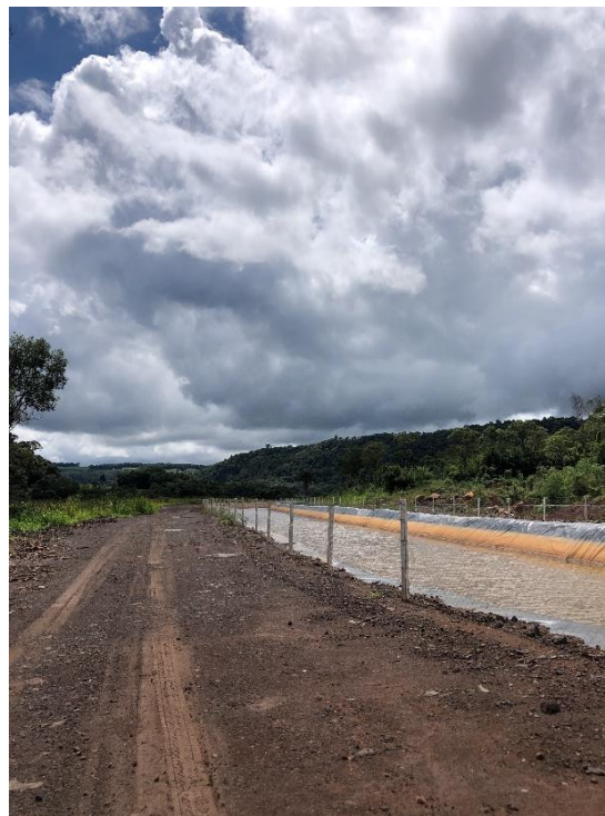
Figura 4 - Exemplo de canal cercado.