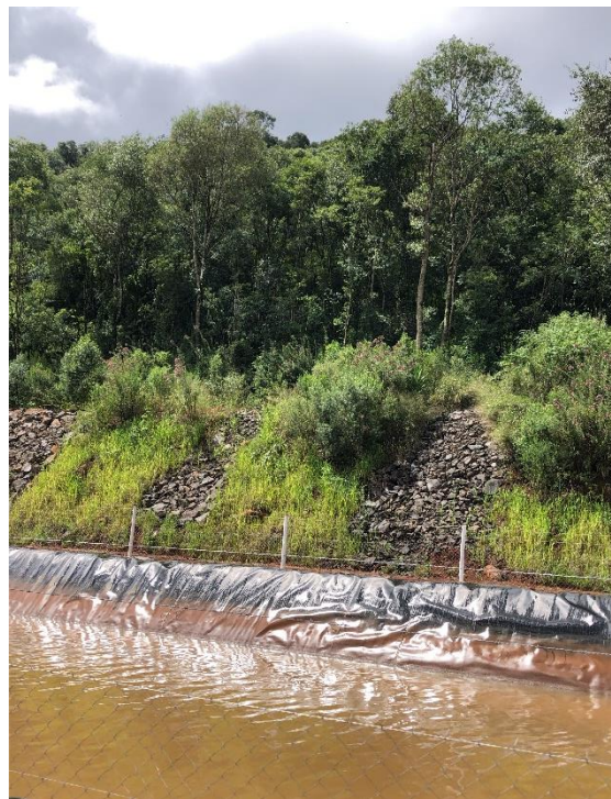
Figura 6 - Exemplo de canal cercado.