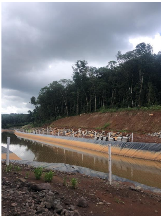
Figura 3 - Exemplo de canal cercado.