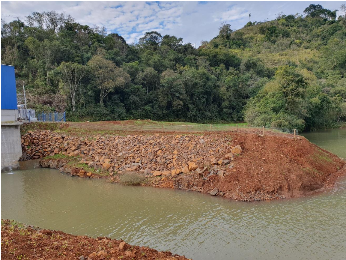
Figura 8 - Cercamento do canal de fuga da CGH Tapera 2A