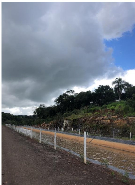
Figura 5 - Exemplo de canal cercado.